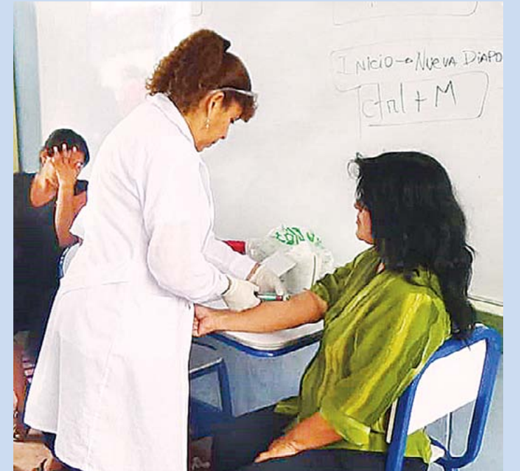
LAS PRUEBAS DE LABORATORIO son las más demandadas para conocer si están infectados de Covid.

Los exámenes de laboratorio son los que más se practican en esta ciudad debido a su accesibilidad, toda vez que los test PCR son aún limitados a más de dos años de la pandemia.