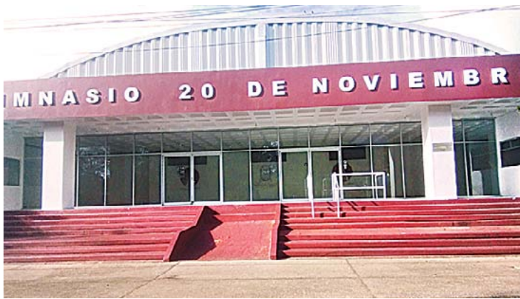
EL GIMNASIO MUNICIPAL "20 DE NOVIEMBRE", será utilizado por personal del IMSS para realizar pruebas rápidas de Covid 19.

El espacio deportivo permanecerá cerrado desde hoy hasta el 24 de febrero