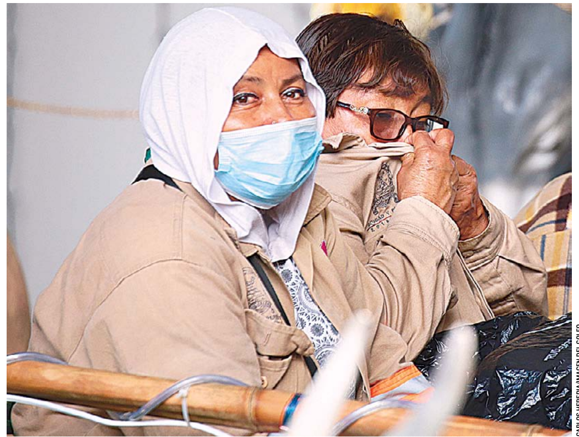
SE RECOMIENDA no bajar la guardia, el uso del cubrebocas es primordial para evitar contagios.

Sin embargo es la población de los 25 a los 49 años la que aparece como el rango